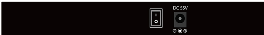
Power on/off Switch DC Power Input