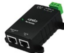
30Watt Gigabit PoE+ Injector