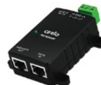
30Watt Gigabit PoE+ Injector